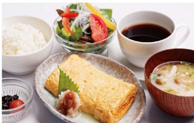
だし巻き玉子定食 / 800円