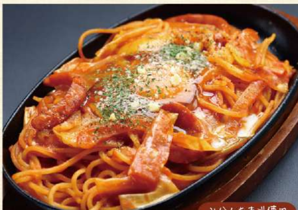
みかんたまご使用