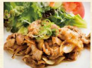
🍖 ポークジンジャー