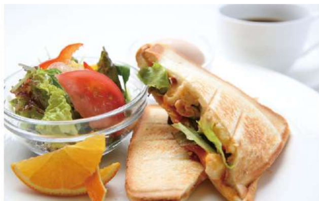
ホットサンドセット / 770円