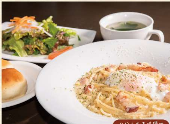
みかんたまご使用