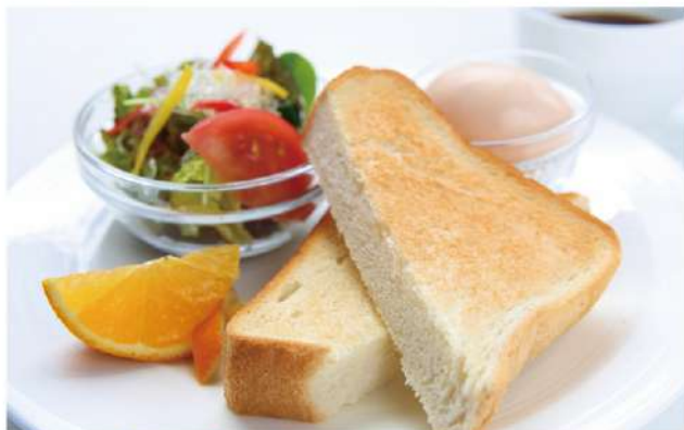
トーストセット / 720円