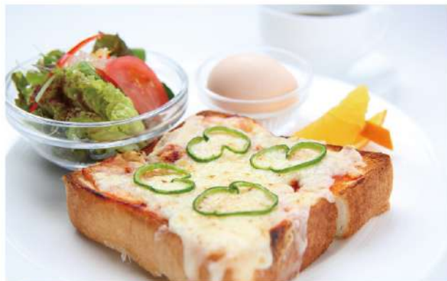
ピザトーストセット / 770円