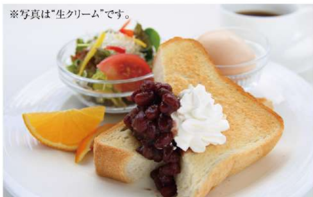
小倉トーストセット / 880円