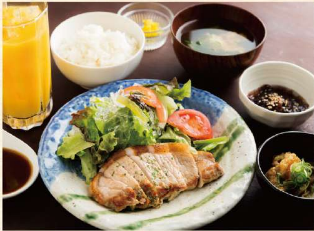
※写真はポークステーキです