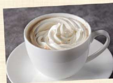
*ウインナーコーヒー*