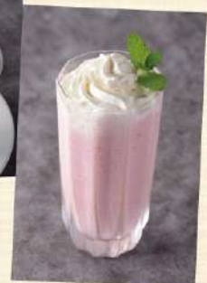
*イチゴスムージー*