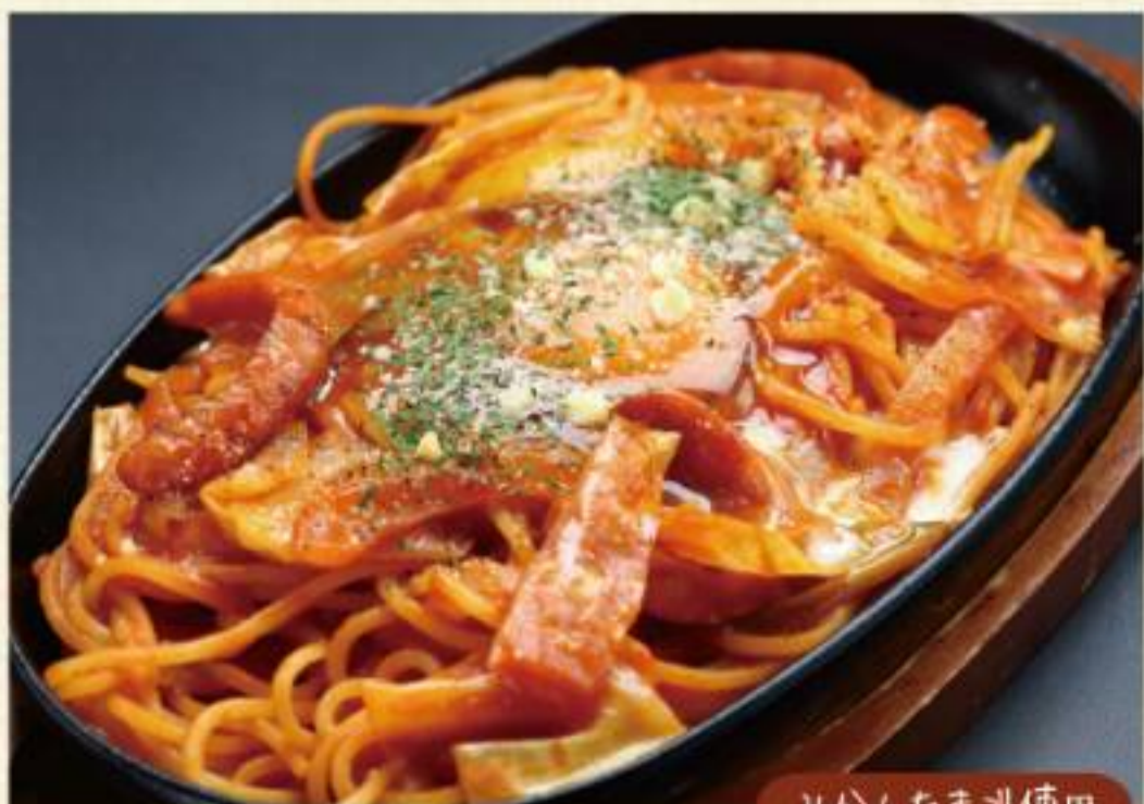
みかんたまご使用