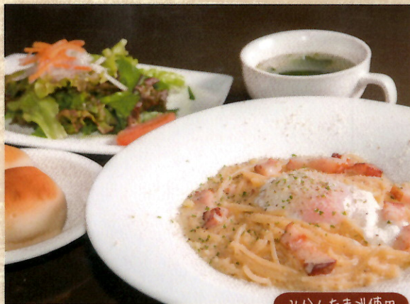
みかんたまご使用