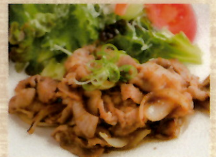
🐷 ポークジンジャー