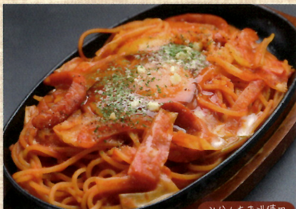
みかんたまご使用