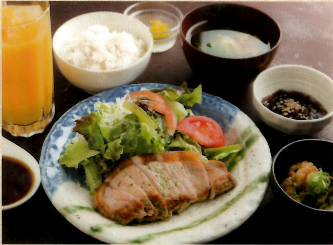
※写真はポークステーキです